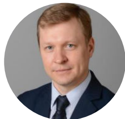
Иванов Андрей Юрьевич Первый заместитель Министра экономического развития РФ