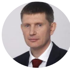
Решетников Максим Геннадьевич Министр экономического развития РФ