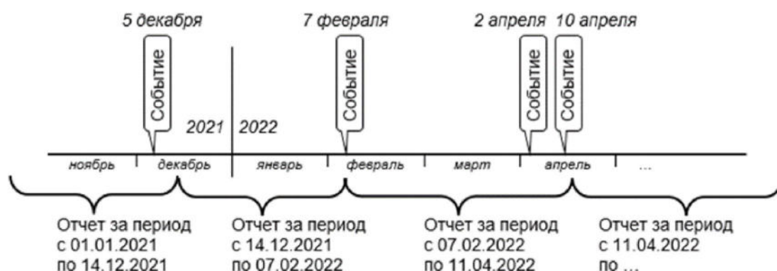
Рисунок 1. Схема определения даты окончания периодов оперативной отчетности

На рисунке 1 представлена схема определения даты окончания периодов оперативной отчетности.