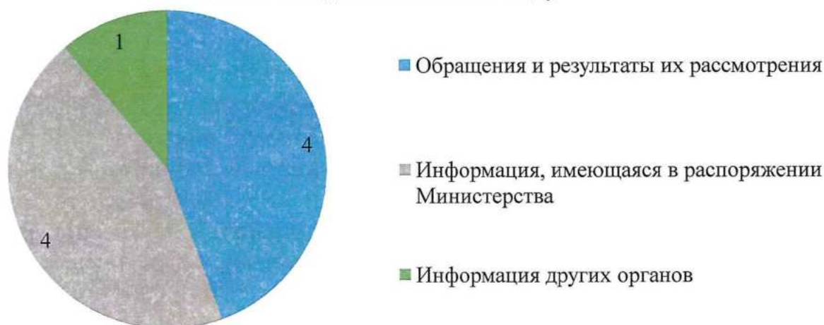
Основания проведения контрольных (надзорных) мероприятий без взаимодействия в 2023 году

В рамках программы профилактики рисков причинения вреда (ущерба) охраняемым законом ценностям при осуществлении регионального государственного геологического контроля (надзора) на 2023 год объявлено 7 предостережений о недопустимости нарушения обязательных требований в области недропользования, проведено 5 профилактических визитов и 11 консультирований.